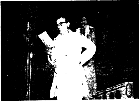
उत्सव के सभापति श्री वियोगीहरि का भाषण